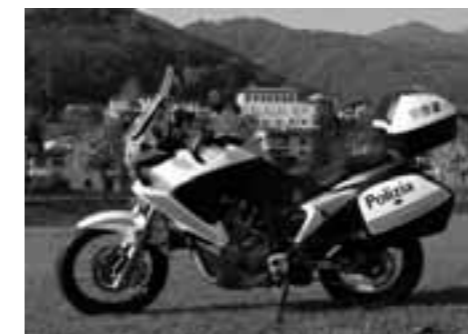
In alto la nuova moto.

Con la due ruote è inoltre possibile essere di supporto a manifestazioni particolari, che prevedono un servizio di sicurezza, quali ad esempio i recenti Mondiali di ciclismo su strada.