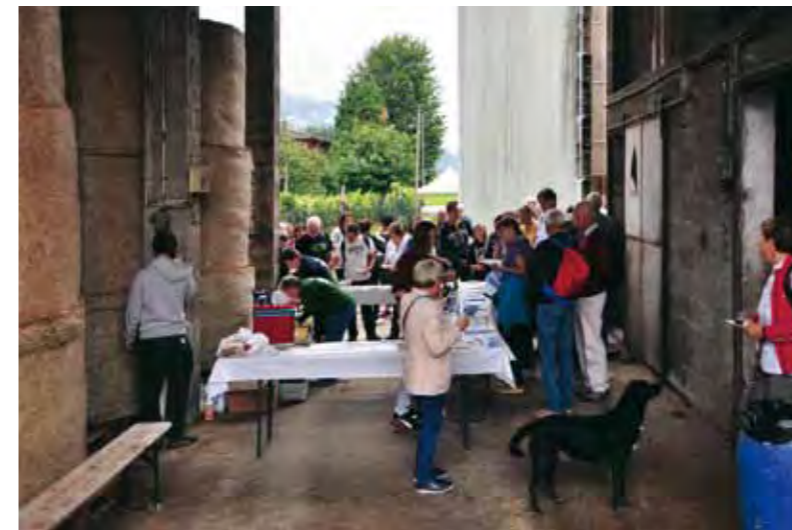
Mulini di Bioggio, sosta e degustazione