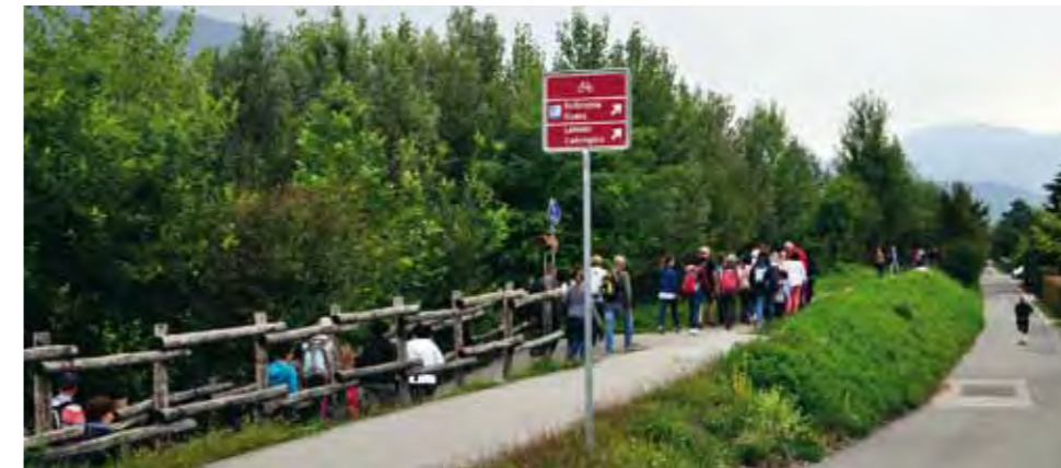
Agno, lungo il fiume

Malgrado la meteo non proprio favorevole di settembre, un folto gruppo di cittadini di Agno, Bioggio e Manno ha percorso, lungo il tracciato della Strada Regina ed altri sentieri pedonali, il tragitto che dal lago li ha portati al Parco Giova. È stata una simpatica occasione di incontro che si è conclusa con un bel pranzo e la possibilità di testare veicoli elettrici, momento organizzato in collaborazione con Energia ABM.