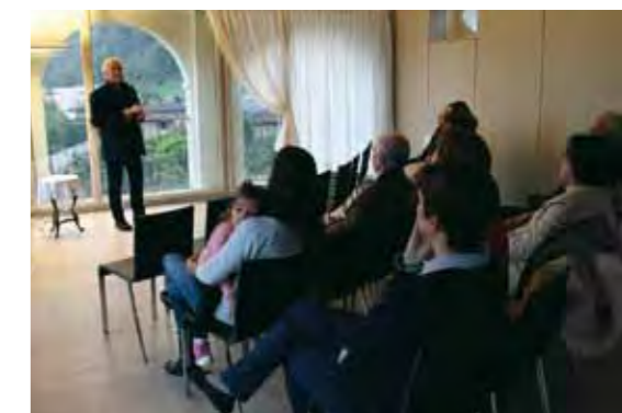
Camera con vista