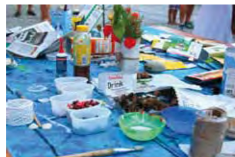
Crea e ricicla