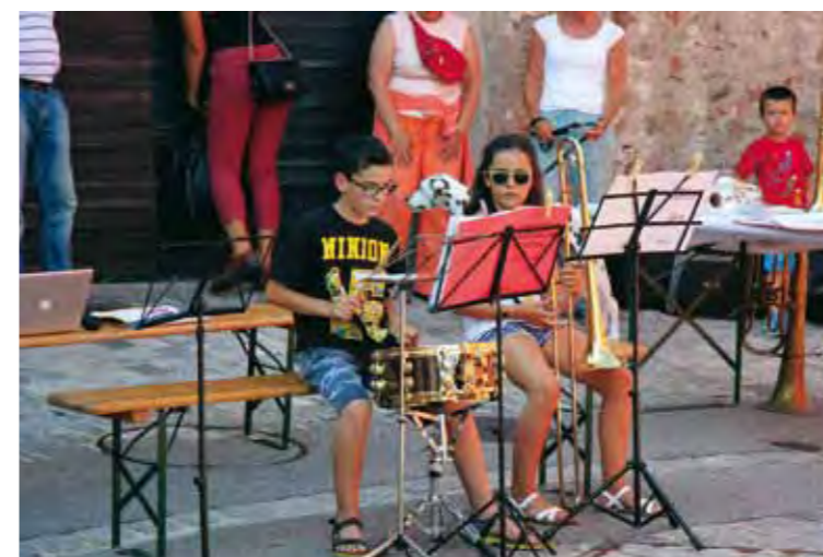
Non solo musica