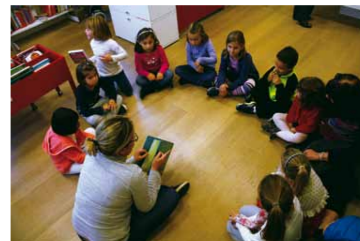
Stanza dei bambini