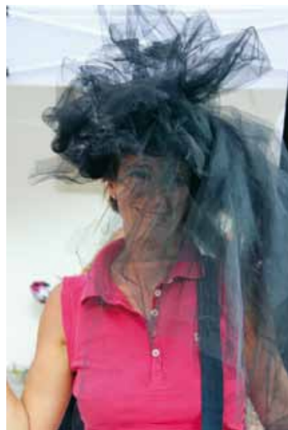
Gioca... fai finta