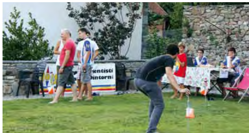
Corri contro il tempo