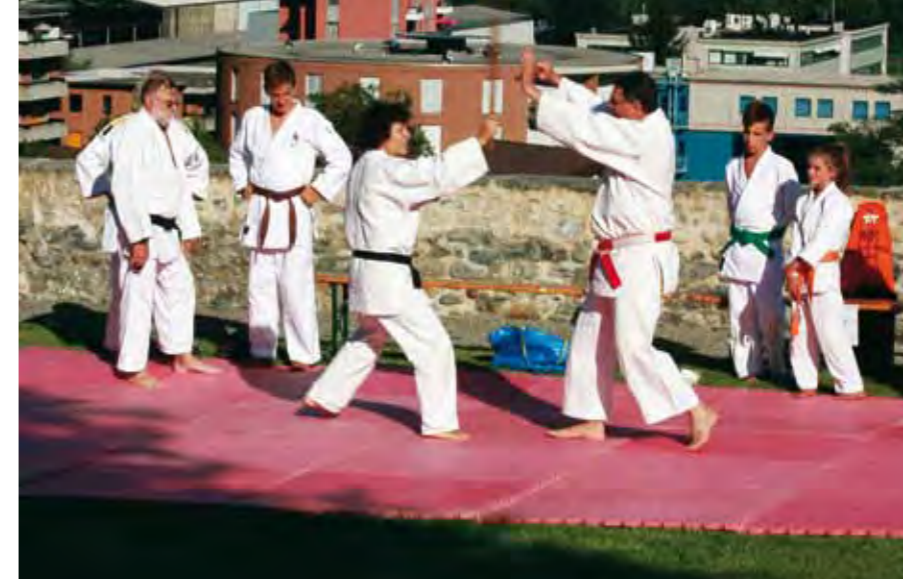
Sciogli i muscoli