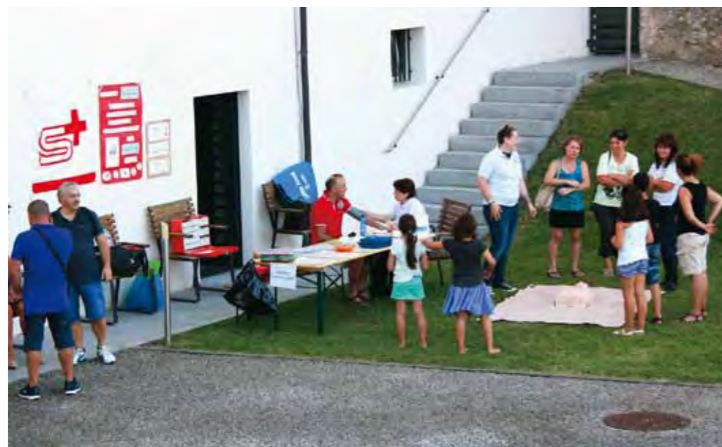
Bassa o alta pressione