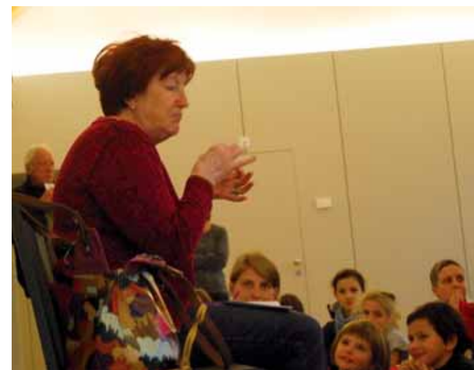
Bambini e adulti ascoltano divertiti un racconto

La Biblioteca accoglie sempre volentieri nuovi utenti e nuovi volontari. Informazioni sul sito www.manno.ch , biblioteca@manno.ch o telefonando durante gli orari di apertura allo 091 611 10 07.