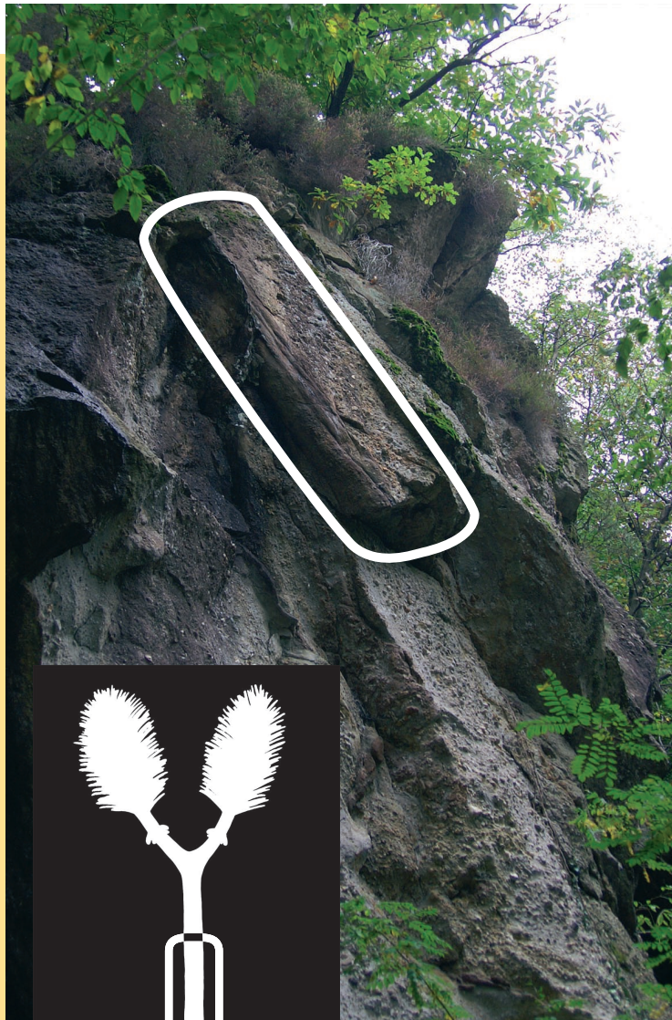
Tronco di Sigillaria e ricostruzione dell'albero Stamm eines Siegelbaums Sigillaria und Rekonstruktion des Siegelbaums | Tronc d'une sigillaire (Sigillaria) et reconstruction de l'arbre | Trunk of a Sigillaria and reconstruction of the tree