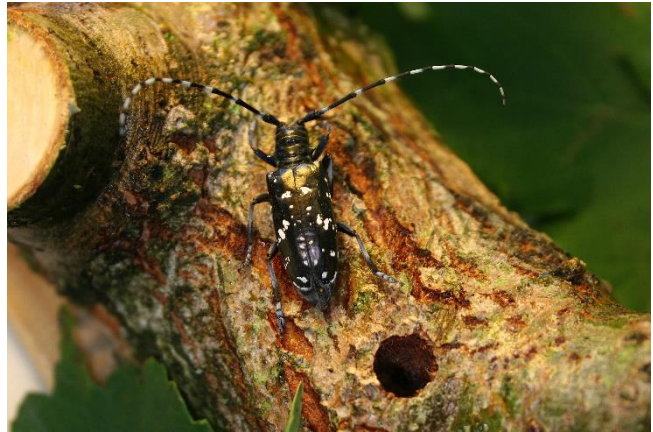
Foro di sfarfallamento