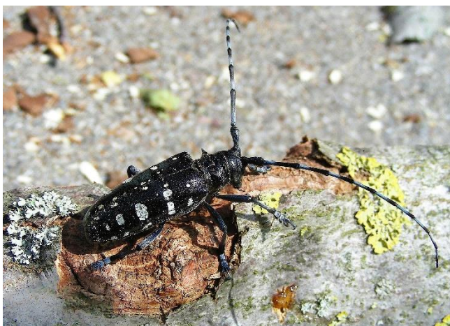
Il tarlo asiatico del fusto ( Anoplophora glabripennis )

Il tarlo asiatico del fusto ( Anoplophora glabripennis ) e il tarlo asiatico delle radici ( Anoplophora chinensis ) sono due coleotteri invasivi originari dall'Asia che possono provocare danni importanti a molte specie di latifoglie presenti sul nostro territorio. Regolamentati come organismi di quarantena prioritari, vige l'obbligo di notifica e di lotta. Il Cantone deve garantire il monitoraggio sul territorio e, in caso di ritrovamento, intervenire con delle misure molto costose quali l'abbattimento e la distruzione integrale tramite cippatura degli alberi infestati o abbattimenti preventivi di potenziali piante ospiti.