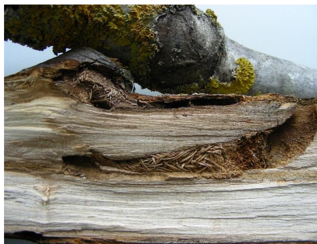
Albero danneggiato con le gallerie scavate dalle larve