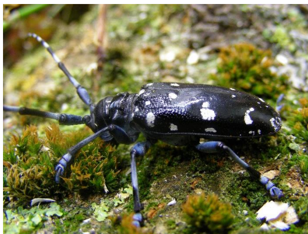
Il tarlo asiatico delle radici ( Anoplophora chinensis)