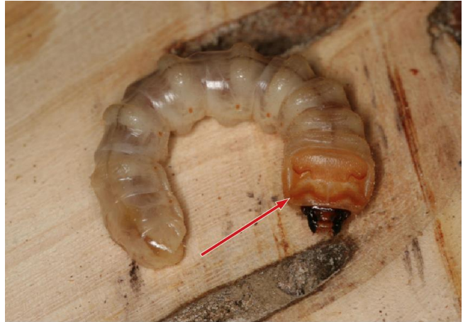
Larva del tarlo asiatico delle radici