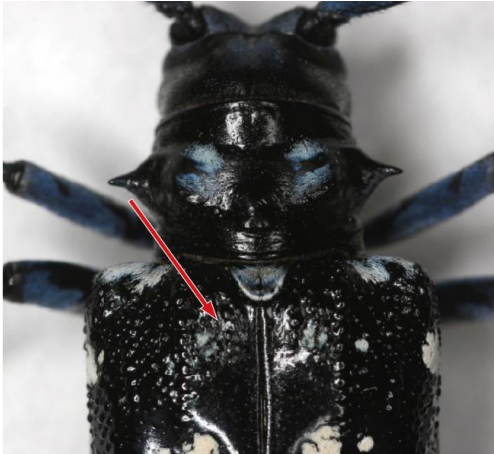
Elitre con la base granulosa del tarlo asiatico delle radici